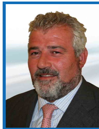
Ginés Moreno García Candidato a la Alcaldía de Fuente Álamo por el Partido Popular